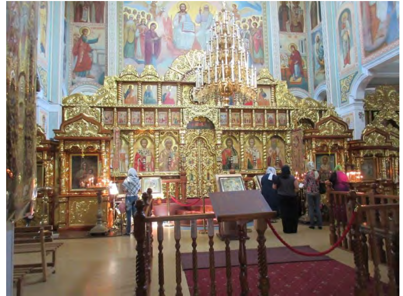
St. Nicolas Cathedral Almaty